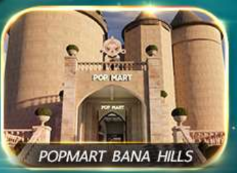
POPMART BANA HILLS

สัมพัสความงามหมู่บ้านฝรั่งเศสที่บานาฮิลล์ ซ้อปปิ้ง POPMART เยือนเมืองโบราณฮอยอัน ล่องเรือกระดิง วัดหลินอึ้ง สะพานมังกร