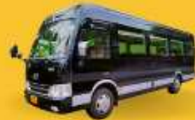
BUS (10-18 ท่าน)