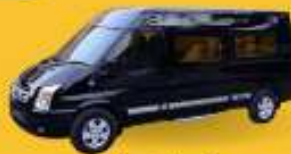
VAN (7-8 ท่าน)