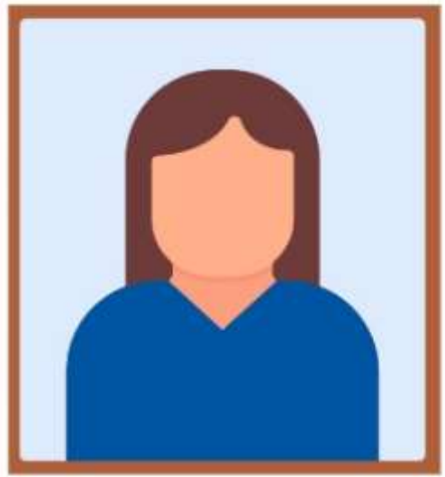
รูปถ่ายหน้าตรง