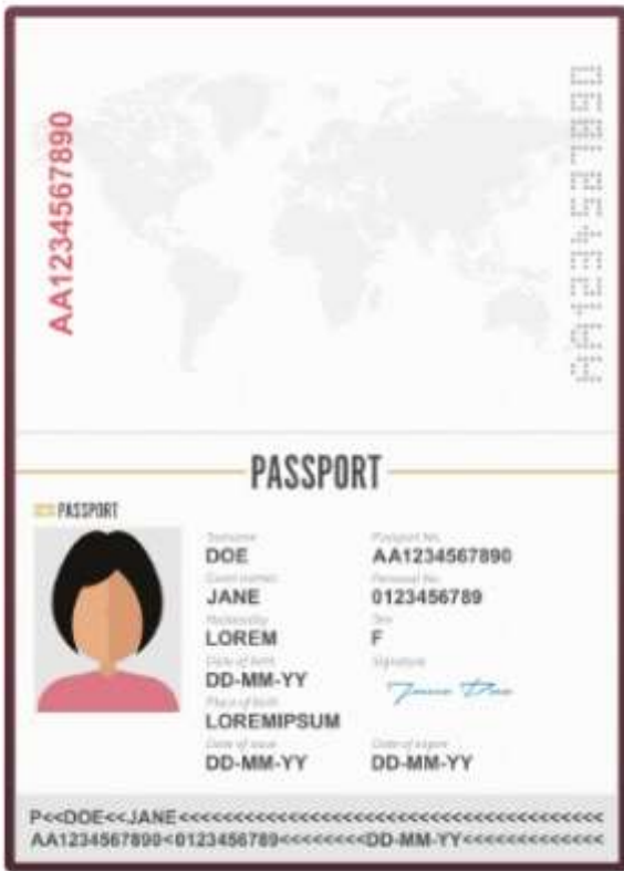
รูปถ่ายหน้าพาสปอร์ต