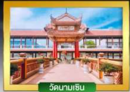
วัดนามเชิน