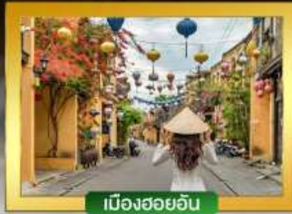
เมืองฮอยอัน