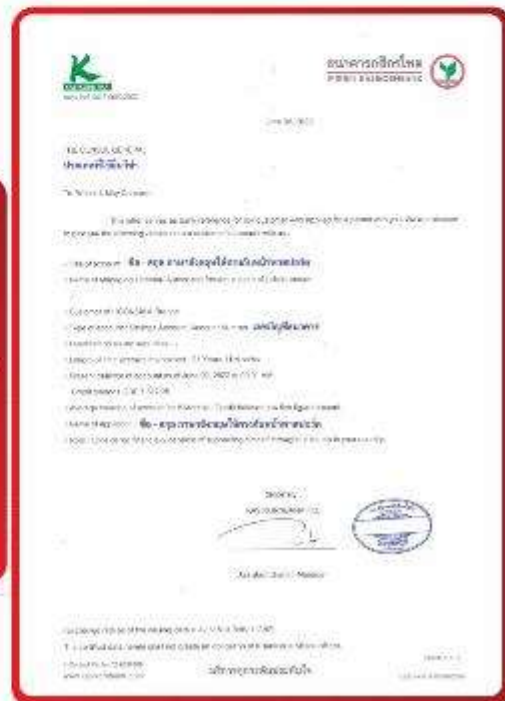
ตัวอย่าง Bank Guarantee ที่ผู้สมัครต้องยื่นมาด้วย