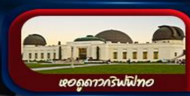
หอดูดาวกริฟฟิท

การันตี 10 ท่านออกเดินทาง พร้อมหัวหน้าทัวร์คนไทย