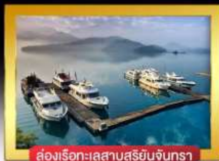
ส่องเรือทะเลสาบสุริยันจันทรา