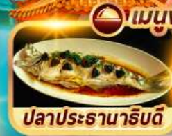
ปลาประจักษ์