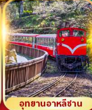
อุทยานอาหลี่ซาน