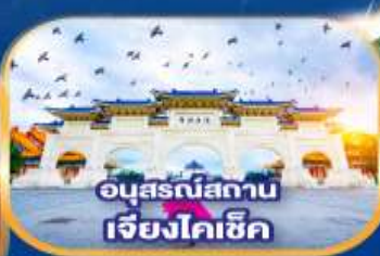
อนุสรณ์สถาน เจียงไคเช็ก