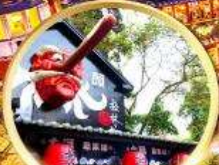
หมู่บ้านปิต่างชไต