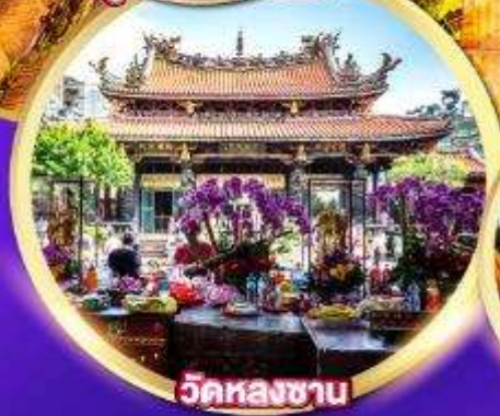
วัดหลงชาน