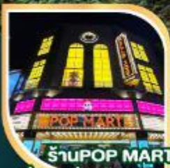
ร้านPOP MART ที่ใหญ่ที่สุดในโลกไม่ได้หวั่น