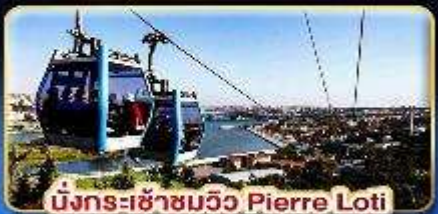
นั่งกระเช้ามวิว Pierre Loti