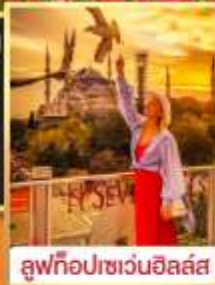
ลูฟทีอปเซเวนฮิลส์

01-09, 04-12, 05-13, 06-14 เม.ย. 68 27 พ.ค.- 04 มิ.ย. 68 09-17, 19-27 เม.ย. 68 31 พ.ค.- 08 มิ.ย. 68 24 เม.ย.-02 พ.ค.68 / 01-09 พ.ค. 68 01-09, 06-14, 07-15, 09-17 มิ.ย. 68 04-12, 08-16, 10-18, 12-20 พ.ค. 68 13-21 มิ.ย. 68 / 14-22, 20-28 มิ.ย. 68 13-21, 16-24, 17-25, 23-31 พ.ค. 68 21-29 มิ.ย.68 / 27 มิ.ย. - 5 ก.ค.68