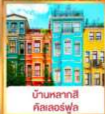
บ้านหลากสี คิสเลอร์ฟูล