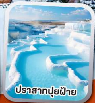
ปราสาทปูยฝาย