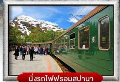
นั่งรถไฟชมสเปนา

พิเศษ! พักบนเรือสำราญ แบบ Window Room 2 คืน, พักบ้านแซนต้าคลอส