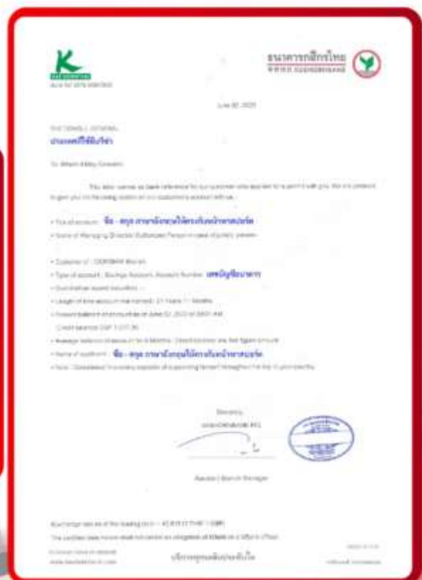
ตัวอย่าง Bank Guarantee ที่ผู้สมัครต้องขอจากธนาคาร