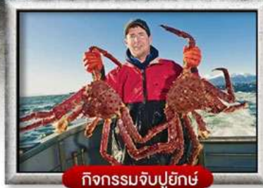
กิจกรรมจับปูยักษ์