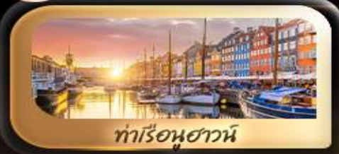
ท่าเรือฮาวน์