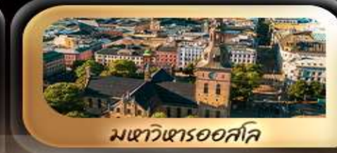
มหาวิหารออสโล