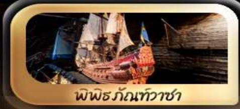
พิพิธภัณฑ์ท้าวชา