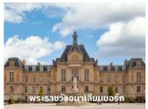
พระราชวังมาเลเซียนบอร์ก