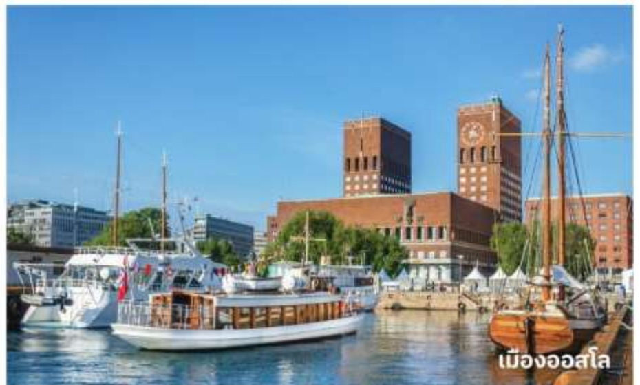
เมืองออสโล