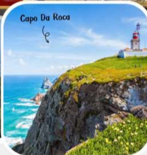
Capo Da Roca