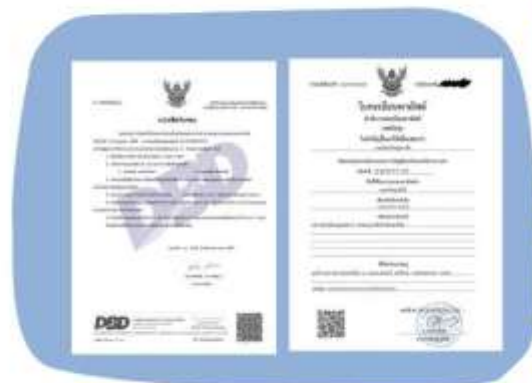
ตัวอย่างหนังสือจดทะเบียนบริษัทฯ และ ใบทะเบียนพาณิชย์