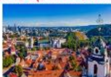
Vilnius Old Town