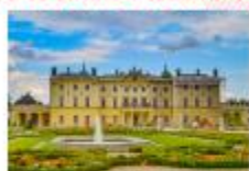
พระราชวัง Branicki