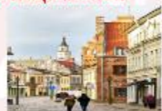
Kaunas Old Town

** พักที่ Holiday Inn Vilnius Hotel 4* หรือเทียบเท่า **