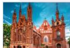
โบสถ์เซนต์แอน