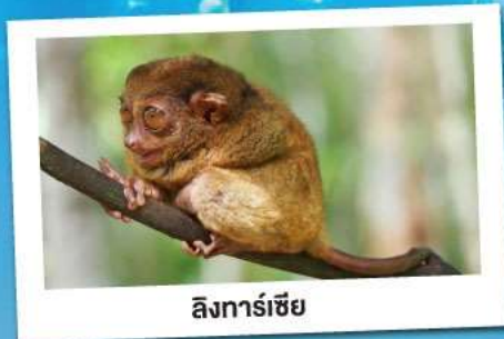
ลิงการ์เซียร์