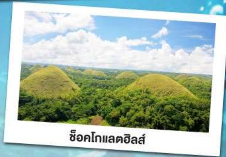
ช็อคโกแลตฮิลล์