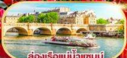
ส่องเรือแม่น้ำแซนน์