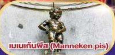
แมนเก้นพีส (Manneken pis)