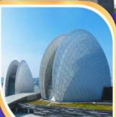
โรงละครหอยโขงบุก