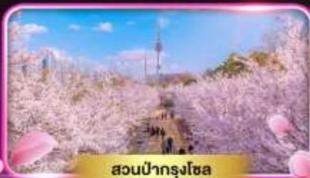
สวนป่ากรุงโซล