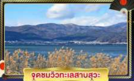
จุดชมวิวกะเลสาบสวะ