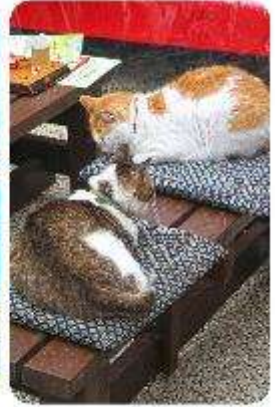
เกาะเอโนะชิมะ

เมืองคามาคุระ (Kamakura) เมืองน่ารักติดทะเล ตบโจทย์ที่เที่ยวที่ผสมผสานระหว่างประวัติศาสตร์ ธรรมชาติ และความงามของทะเล บอกเลยใครมาต้องตกหลุมรักกับเมืองสุดชิล อย่าง คามาคุระ เมืองเล็กๆ ที่ตั้งอยู่ทางตอนใต้ของจังหวัดคานากาวะ ห่างจากโตเกียวเพียงแค 1 ชั่วโมง เท่านั้น แต่เต็มไปด้วยสถานที่ท่องเที่ยว ทิวทัศน์ธรรมชาติ และชายหาดที่งดงาม ที่นี้จะทำให้ทุกคนรู้สึกเหมือนได้ย้อนกลับไปสัมผัสประวัติศาสตร์ญี่ปุ่นในยุคซามูไร พร้อมทั้งได้ผ่อนคลายท่ามกลางบรรยากาศที่เงียบสงบและสดชื่น