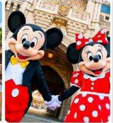
โตเกียวดิสนีย์แลนด์

แนะนำที่เที่ยว อิสระด้วยตัวเองเต็มวัน ! เลือกซื้อทัวร์เสริมอิสระดิสนีย์แลนด์ (ไม่มีหัวหน้าทัวร์และไม่มีไกด์นำเที่ยว) เอาใจแฟนพันธุ์แท้ของดิสนีย์ กับ สวนสนุกโตเกียวดิสนีย์แลนด์ ที่เต็มไปด้วยการผจญภัย ความสนุกสนานในโลกลึกลับเมื่อดำเนินทางเข้าสู่ สวนสนุกโตเกียวดิสนีย์แลนด์ จะพบกับธีมพาร์คที่ แบ่งออกเป็น หลากหลาย เช่น Adventureland ที่เต็มไปด้วยการผจญภัยในป่าและน้ำตก, Fantasyland ดินแดนของตัวละครดิสนีย์ที่คุณหลงใหล, และ Tomorrowland ที่จะพาคุณไปสำรวจอนาคตที่เต็มไปด้วยนวัตกรรม และเปิดประสบการณ์ใหม่ที่ Tokyo Disney Sea ที่จะพาคุณไปผจญภัยยังโลกทะเลและการผจญภัยทางน้ำ นอกจากนี้เรายังเพลิดเพลินกับร้านอาหารและคาเฟ่รวมไปถึงของฝากจากดิสนีย์อีกมาย (ค่าทัวร์ยังไม่รวมบัตรค่าเข้า)