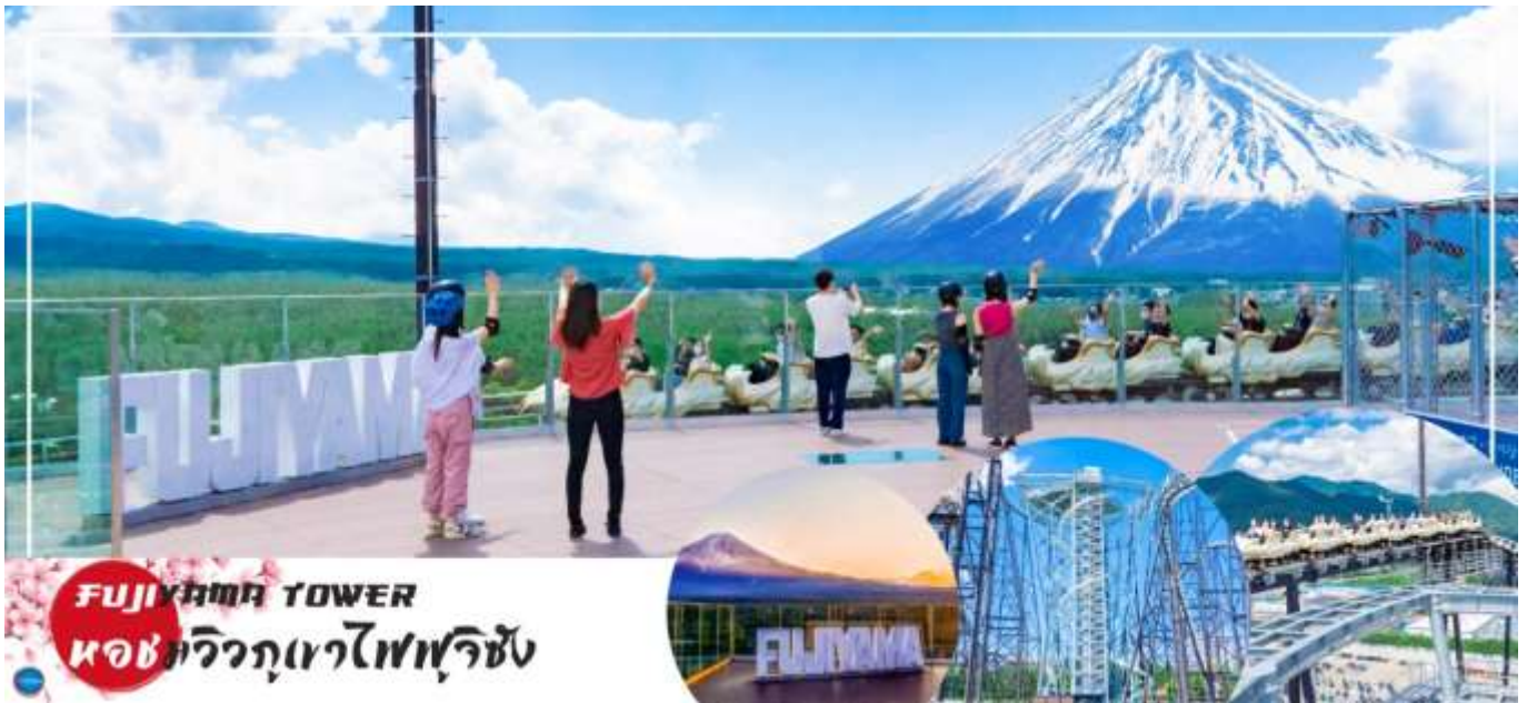
FUJINUMA TOWER หอชมวิวภูเขาไฟฟูจิ

เดินทางสู่ กรุงโตเกียว (Tokyo) (ใช้เวลาเดินทางประมาณ 1.40 ชั่วโมง) เมืองหลวงของประเทศญี่ปุ่น ตั้งอยู่ในภูมิภาคคันโต (Kanto) บนเกาะฮอนชู (Honshu) ในอดีตคือเมืองเอโดะ (Edo) มีรถไฟสายยามานาโนเตะ (Yamanote) วนเป็นวงกลมอยู่ใจกลางเมือง มีสถานที่ท่องเที่ยวมากมาย เป็นจุดหมายปลายทางยอดนิยมของนักท่องเที่ยวทั่วโลก