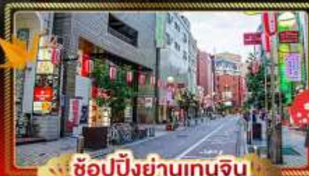
ช้อปปิ้งย่านเทนจิน