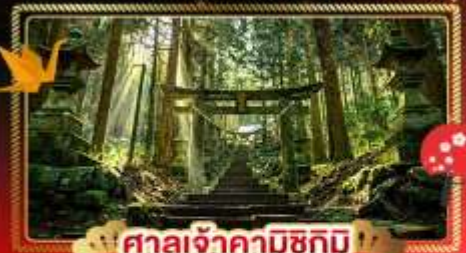
ศาลเจ้าคามิซึกิ