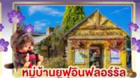
หมู่บ้านยูฟูอินฟลอร์ริล