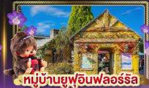
หมู่บ้านยูฟูอินฟลอร์ริล