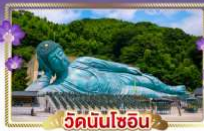
วัดนันโซอิน