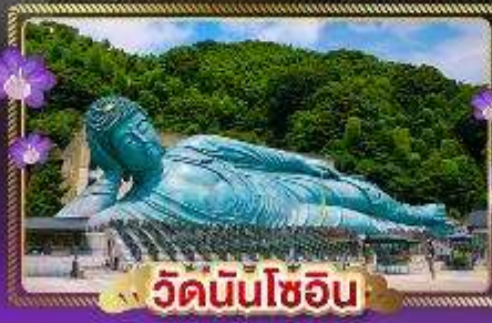
วัดนินโซอิน