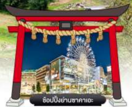
ซ็อบบิงย่านซาคาเอะ