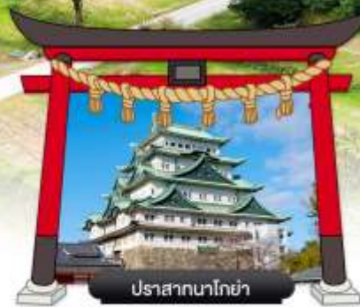
ปราสาทนาโกย่า