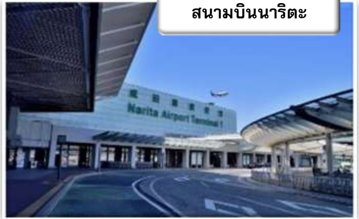
สนามบินนาริตะ

สวนอุเอโนะ (UENO PARK) เรียกว่าเป็นสวนสาธารณะขนาดใหญ่ของโตเกียว โดยภายในมีทั้งวัด ศาลเจ้า ทะเลสาบ และสวนสัตว์ มีต้นไม้มากมายให้บรรยากาศร่มรื่นจึงเป็นสถานที่ที่ชาวโตเกียวนิยมมาพักผ่อนกันมีต้นซากุระเรียงรายอยู่ทั้งสองข้างยาวไปตามทางเดินภายในสวน มีจำนวนมากกว่า 1,000 ต้นซึ่งมักจะบานช่วงประมาณปลายเดือนมีนาคมถึงต้นเดือนเมษายน ทำให้ดึงดูดผู้คนจำนวนมากมาเยี่ยมชมในเทศกาลชมดอกซากุระ หรือที่เรียกกันว่า เทศกาลงานฮานามิ