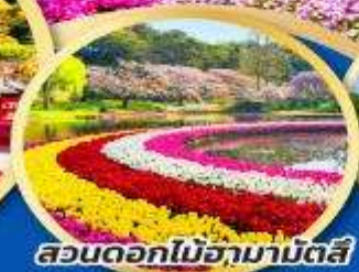
สวนดอกไม้ฮามามัตสึ