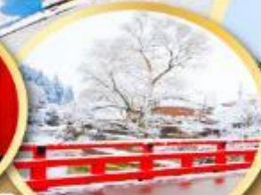
สะพานนากะบาชิ