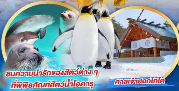
ชมความน่ารักของสัตว์ต่างๆ ที่พิพิธภัณฑ์สัตว์น้ำโอตารุ