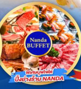
พิเศษบุฟเฟ่ต์ บึงย่างร้าน NANDA