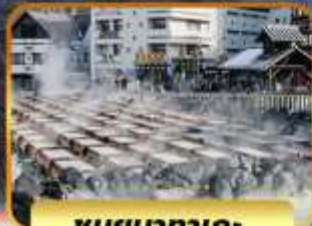
ชมยูบาทาเกะ