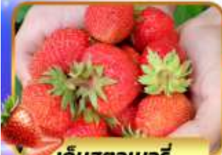
เก็บสตอเบอร์รี่