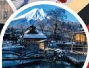
หมู่บ้านโอฮิโนะฮักโก