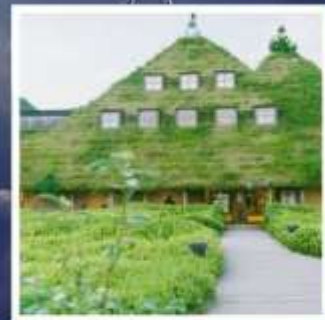
ลา โคสึน่า โอมิสะจิมัง

พิเศษท่องเที่ยวสวนสนุกยูนิเวอร์ซัล สตูดิโอส์เต็มวัน สวนสาธารณะซากุระปราสาทคาคาโตะ 1 ใน 3 สุดยอดจุดชมซากุระแห่งญี่ปุ่น สักการะพระพุทธรูปในอาคาร ที่ใหญ่ที่สุดในญี่ปุ่น เอจิเซ็นโดบุตสึ เปิดประสบการณ์อัศจรรย์กำแพงหิมะ บนเทือกเขาเจแปนแอลป์ ชมประวัติศาสตร์และร้านขนมดังลา โคสึน่า แห่งเมืองโอมิสะจิมัง พักผ่อนเป็นอย่างดี 3 คืน 2 ริมทะเลสาบ!!! อาหารพิเศษ...บุฟเฟ่ต์อาหาร + เครื่องดื่มแอลกอฮอล์ไม่อั้น กรุ๊ปสบายๆ เพียง 20 ท่านเท่านั้น!!!