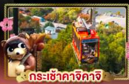
กระเช้าคาจิกาจิ