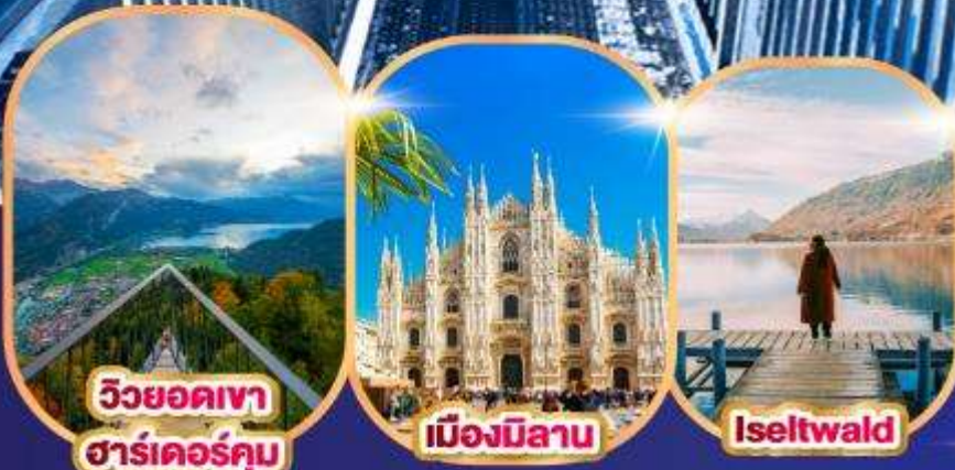
วิวยอดเขา ซาร์เตอร์คัม