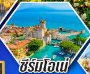
ซีร์มิโอนี