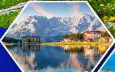
ทะเลสาบมิสุร์น่า