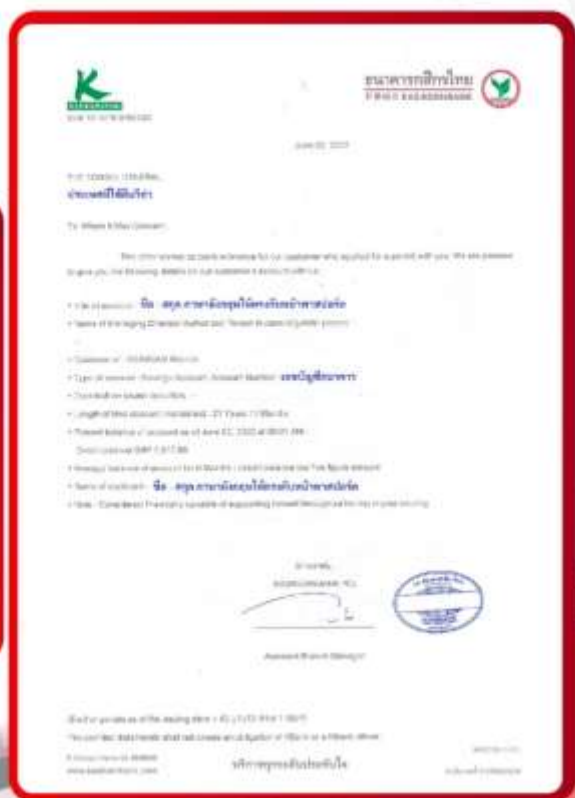
ตัวอย่าง Bank Guarantee ที่ผู้สมัครต้องยื่นเอกสาร