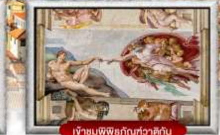
เข้าชมพิพิธภัณฑ์ทิวาติกัน

เมนูพิเศษ! สปาเกตตี้เส้นหมึกดำ, พิชซ่าสไตล์อิตาลีเย็นแท้