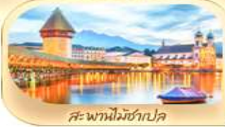
สะพานไมซ์าเปล