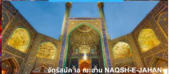
จัตุรัสมีก 16 พระฮาน NAQSH-E-JAHAN