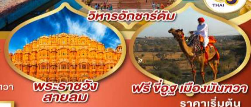
วิหารอักชาร์ดัม