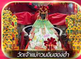
วัดเจ้าแม่ทวนอิมฮองอำ