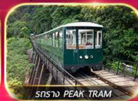
รถราง PEAK TRAM

เที่ยวสวนสนุกแบบจัดเต็ม ทั้งอิมบูกู และ ซอปปิง จิมซาจุ่ย มงกอก