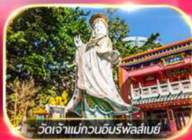
วัดเจ้าแม่ทวนอิมพรหลี่เบย์