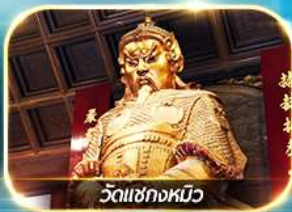
วัดเขากงหมิว