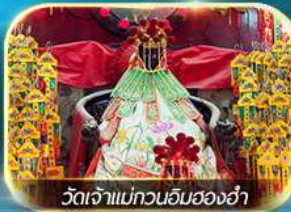
วัดเจ้าแม่กวนอิมของฮ่า