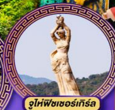
จูไห่พีชเชอร์เกิร์ล