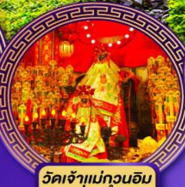
วัดเจ้าแม่กวนอิม ฮ่องฮ่า