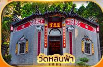
วัดหลินฟา