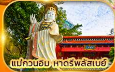
แม่กวนอิม หาดรีพลัสเบย์