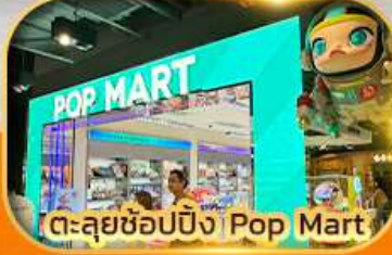
ตะลุยช้อปปิ้ง Pop Mart