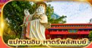
แม่กวนอิม หาดริฟลิสเบย์