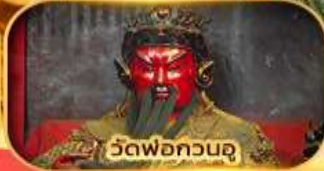
วัดพ่อกวนอู