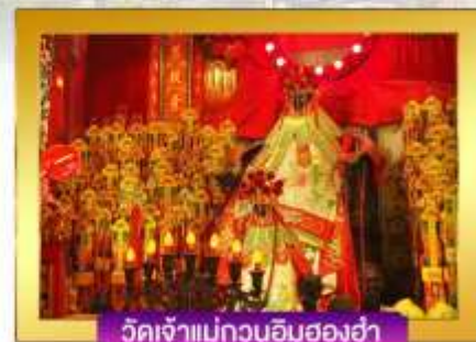
วัดเจ้าแม่กวนอิมสองฮา